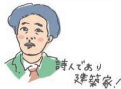
詩人であり建築家！

別所沼公園にぼつりと佇む、「ヒアシンスハウス」と呼ばれる小さな木の家。これは、青年の悲しみや苦悩を表現した四季派の詩人・立原道造が、自身の週末住宅として設計したものだ。彼の存命中にこの家が建つことは叶わなかったが、60年以上の時を経て有志の人々によって建設が実現。ヒアシンスはギリシャ神話に登場する花で、その神話に魅せられた立原は、彼の詩集や書簡にもヒアシンスという名をつけている。