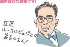
巨匠 ル・コルビュジエの 弟子の1人！

その他に「埼玉県立歴史と民俗の博物館」や「埼玉県立自然の博物館」も県内にある前川國男設計の建築です！