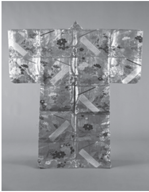
《唐織 有卦船模様》弘化3年 国立能楽堂蔵

ところで、展覧会の準備を進める中で、別の美術館で、同じく弘化三年の五月に嫡子である慶寧より贈られた富士山と二葉葵模様という、「ふ」づくしの長絹も見つけてしまいました。こちらは(藤)の後シテか…。今号の裏表紙には、本展に出品する「ふ」づくしの能装束ばかり集めてみました。十二年後ということは、安政五年(一八五八)も有卦入りの年なのです。なんの「ふ」模様か、わかりますか？