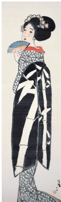
竹久夢二《舞妓舞扇》1917（大正6）年 —「竹久夢二展—憧れの欧米への旅—」より—