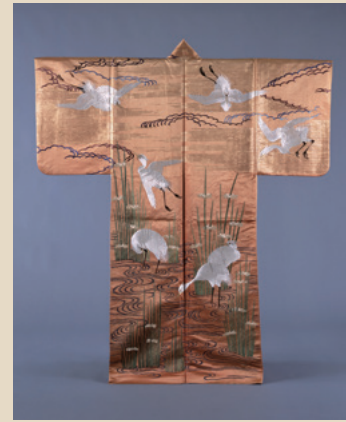
《縫箔 白鷺太藺模様》安政5年 国立能楽堂蔵