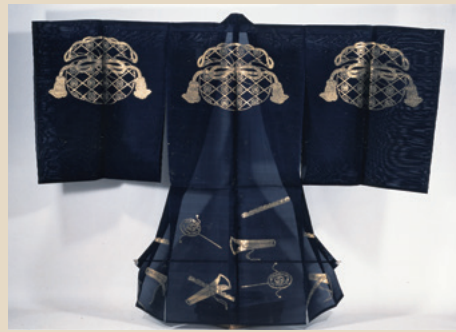
《舞衣 福包に戻り笛振太鼓模様》安政5年 前田育徳会蔵