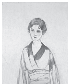
《着物の女》 1931~1933 (昭和6~8) 年

※当日9時30分から展覧会当日券売り場で整理券を配布します。無くなり次第、配布終了。