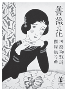
(No.420 「薔薇の花」) 1916年~ (大正5年~昭和初期)