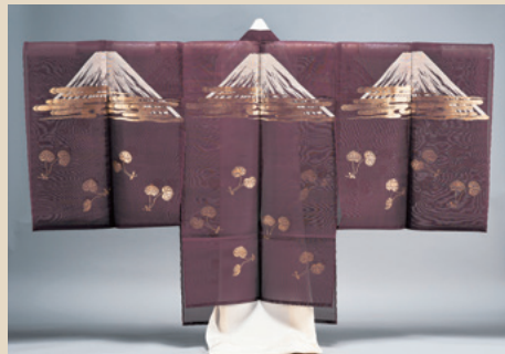
《長絹 富士山二葉葵模様》弘化3年 野村美術館蔵