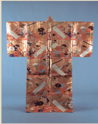
《唐織 有卦船模様》弘化3年 国立能楽堂蔵