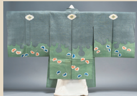
《掛素襖 緑雪二葉葵模様》安政5年 高島屋史料館蔵