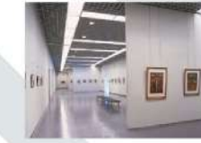
5 第2展示室 Gallery 2 301.46㎡