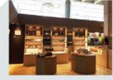
9 ミュージアムショップ Museum Shop