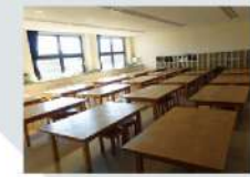
1 第1研修室 Studio 1 91.86㎡