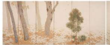
菱田春草《落葉》1909 Shunsō Hishida, Fallen Leaves