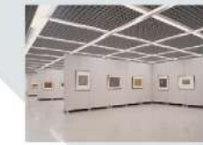
4 第1展示室 Gallery 1 527.40㎡