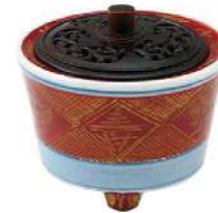
富本憲吉《赤地金彩寿字香炉》1948 Kenkichi Tomimoto, Incense burner with Kotobuki-ji design in gold on red glaze.