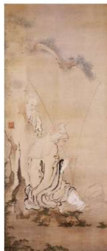
岩佐又兵衛 《鷹居士図》17th C. Matabei Iwasa Hoh Buddhist Layman