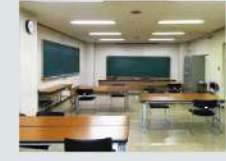
15 第4研修室 Studio 4 76.16㎡