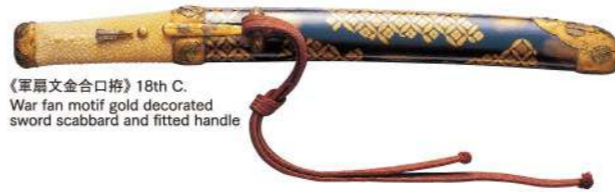
《軍扇文金合口拵》18th C. War fan motif gold decorated sword scabbard and fitted handle