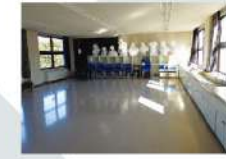
2 第2研修室 Studio 2 90.16㎡