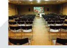
6 講堂 Auditorium/Lecture hall 165.71㎡