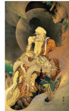
狩野芳崖《伏龍羅漢図》1885 Hōgai Kanō, Arhat with Dragon