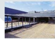
13 屋外展示室 Open-Air Exhibition Area 642.20㎡