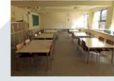
3 第3研修室 Studio 3 113.89㎡