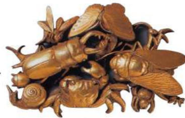
政秀《虫尽図前金具》19th C. Seishū, Insect themed metal tobacco pouch clasp