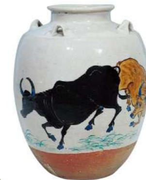
野々村仁清 《色絵牛図茶壺》17th C. Ninsei Nonomura, Tea leaf jar with oxen in overglaze enamels.

福井県立美術館は、県民の美術への関心の高まりを受け、1977 (昭和52)年に開館しました。以来県民のニーズに応えるため、様々な 事業を展開してきました。