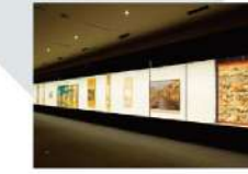
11 第4展示室 Gallery 4 641.70㎡