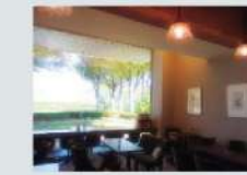
10 美術館喫茶室ニホ Cafe Niho 61.71㎡