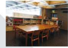
14 レファレンスルーム Reference Room 64.32㎡