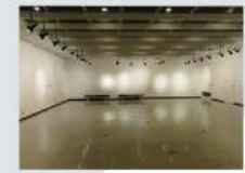
7 貸展示室 Rental Gallery 174.96㎡