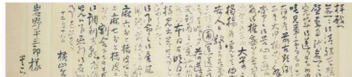
《横山大観書簡 壁面用紙出荷の報に接し着荷を待ちわびる》Dec. 18, 1926 Letter from Taikan Yokoyama