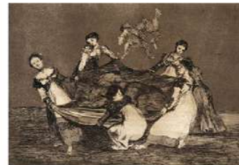
フランシスコ・ゴヤ 《諺(妄)「死んだロバより重く」》1864 Francisco Goya, Los Proverbios-Heavier than a dead donkey (Feminine Folly)

Works by Ninsei Nonomura, Francisco Goya, William Blake, Honoré Daumier, Pablo Picasso, Marc Chagall and others.