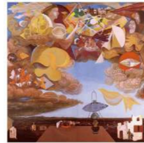
三上誠《F市曼荼羅》1950 Makoto Mikami, F-city Mandala