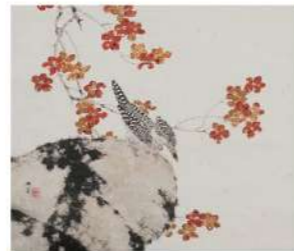
小杉放庵《秋溪》20th C. Hōan Kosugi, Autumn Ravine