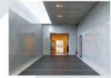
8 ギャラリー Gallery 5 93.72㎡