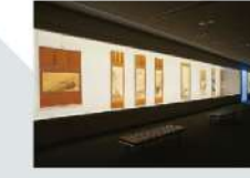
12 第3展示室 Gallery 3 358.89㎡