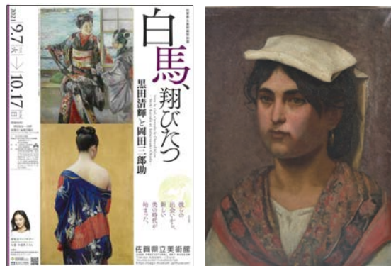
【図2】特別展「白馬、翔びたつ 黒田清輝と岡田三郎助」 （2021年、佐賀県立美術館） 展覧会チラシ

昨半夏、佐賀県立美術館の学芸員の方が百武兼行の《裸婦》を借りに来られました。2021年9月から同館で開催された特別展「白馬、翔びたつー黒田清輝と岡