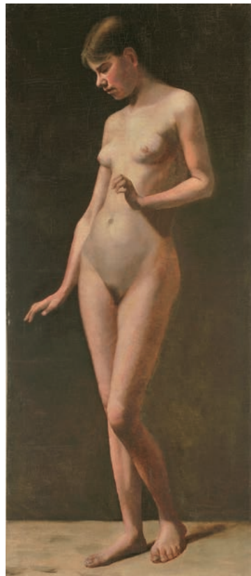
【図1】百武兼行《裸婦》1881（明治14）年頃 油彩・キャンバス、当館蔵

当館の所蔵資料のひとつに、百武兼行が描いた《裸婦》（1881（明治14）年頃、82.8×36.3cm）【図1】があります。小振りの縦長のキャンバスに、すらりとしてポーズをとる裸婦像が描かれた油彩画で、彼女の伏し目がちな表情や、光に照らされた身体の輝きが印象的な作品です。一方でこの作品は、いわゆる大作というわけではありません。もとより来歴を調べてみると、縁あって当館が2011（平成23）年に収蔵した時点では、《習作》（本画の準備や練習のために制作した作品のこと）と呼称されていたようです。