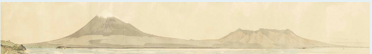
図1 原在正《富士山図巻》第五巻より「駿州富士河」個人蔵