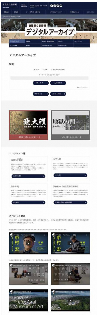
デジタルアーカイブポータルページ https://spmoa.shizuoka.shizuoka.jp/archive/

年制作の《砂川五番》（東京都現代美術館所蔵）は、この時期を代表する一点です。以来、複数のシリーズを展開して現在まで約七十年間にわたり、絵画制作を続けています。当館ではこの中村の作品九点を収蔵しています。動画は、昨冬、