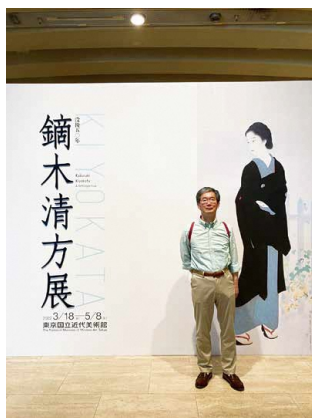
久し振りに訪れた展覧会の会場にて

催されました。美術館の機能、いわゆる「ウラ」側に焦点を当て、作品展示に欠かせないガラスケースや移動壁を主役に据えたほか、照明の光源や照度の違いによる作品の見え方の変化など、安全かつ快適に作品をご覧いただくための様々な工夫を紹介しました。美術館や博物館のバックヤードを取材したテレビ番組も放送されていますが、こうした試みが広がり、美術館、そして作品への理解がさらに進むことを期待しています。