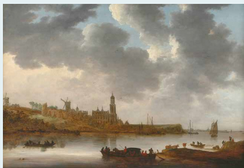
図1 ヤン・ファン・ホイエン《レーネン、ライン河越しの眺め》1648年 当館蔵

日本人が描いた作品にも注目します。清水登之の《セーヌ河畔》(図2)には、ユネスコ世界遺産の登録要件となっているポンヌフ橋やルーヴル美術