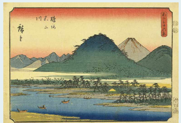
図2 歌川広重《不二三十六景》より「駿河不二川」当館蔵 ※後期展示

ります。江戸絵画に興味をお持ちの方はもちろんのこと、旅行や登山が好きな方にもお楽しみいただけることでしょう。画家たちが追い求めた絶景を巡る旅をご堪能ください。