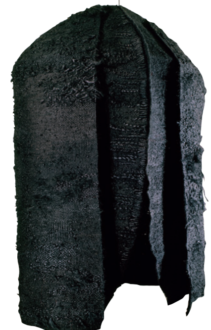
マグダレーナ・アバカノヴィッチ (1930-2017) 《黒い上衣 V》 昭和49(1974)年 300.0×170.0×60.0cm サイザル麻、手織

ポーランド出身の女性作家アバカノヴィッチは、繊維を用いた巨大な作品を発表したファイバー・ワークの先駆者のひとり。あらゆる物事が時間の経過とともに変化し、異なる現象としてあらわれるという考えのもと、作品を次々に発表してきました。この作品は、サイザル麻を手織りして天井から吊るしたもの。「上衣」というタイトルから、そこには存在しないだれかの「身体」を意識させられます。