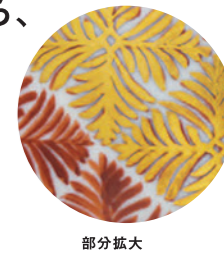
富本憲吉 (とみもと・けんきち 1886-1963) 《色絵金彩羊歯模様大飾壺》 昭和35(1960)年 23.0×27.0×27.0cm 磁器

富本憲吉は「色絵磁器」の技法で人間国宝に認定された、日本の近現代陶芸を代表する作家。「模様から模様を造らず」という精神で、身近な植物のスケッチなどをもとにしながら独自の模様を生み出しました。赤色と金色でシダ模様を市松状に描いたこの作品。よく見ると、金の部分は赤の上からなぞっています。下地の赤が影響して金の発色を深くするために、こうした手法を用いています。