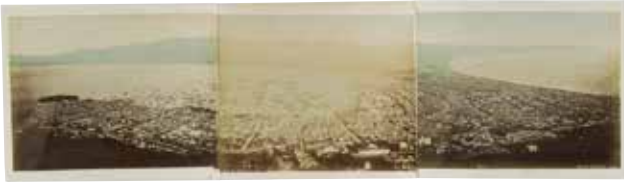
作家不詳 函館港全景 明治25年頃 鶏卵紙