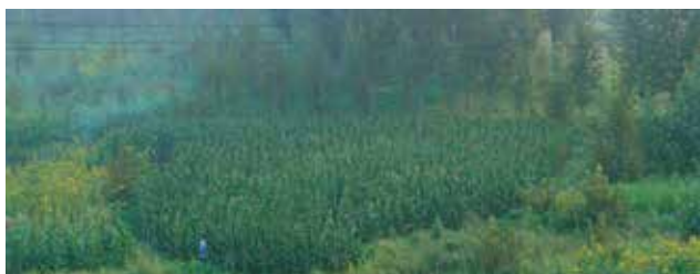
潘逸舟 《トウモロコシ畑を編む》 2021 2チャンネルビデオ、サウンドインスタレーション