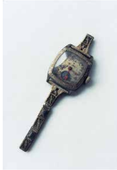
石内都 《ひろしま #88》〈ひろしま〉 2010 発色現像方式印画