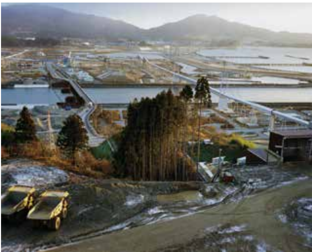
畠山直哉 〈陸前高田〉《2014年12月7日 気仙町愛宕山》 2014 発色現像方式印画