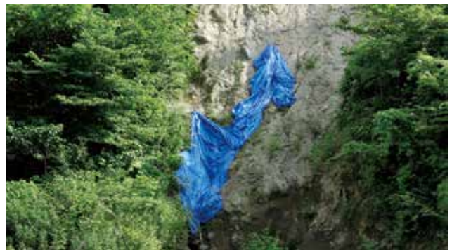
小森はるか+瀬尾夏美 《山つなみ、雨間の語らい》 2021 インスタレーション(写真、映像、サウンド、鉛筆、紙、水彩、アクリル、テキスト、資料)