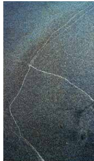
吉田志穂 無題 〈砂の下の鯨〉 2021 インクジェット・プリント