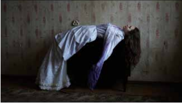
山元彩香 《organ #1 "Marta", Latvia》 2019 シングルチャンネルビデオ