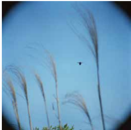
野口里佳 《クマンバチ #3》 2019 発色現像方式印画