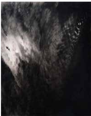
アルフレッド・スティーグリッツ 《イキヴァレント》〈20 No.9〉 1929 ゼラチン・シルバー・プリント