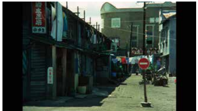
足立正生 他5名 《略称・連続射殺魔》 1969 35ミリフィルム (86分/カラー/サウンド)