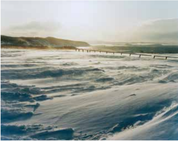
池田宏 《能取岬 網走市 2016年2月》〈AINU〉 2016 発色現像方式印画