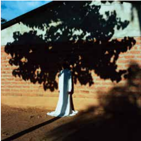
山元彩香 《Untitled #320, Mzimba, Malawi》〈We are Made of Grass, Soil, Trees, and Flowers〉 2019 発色現像方式印画